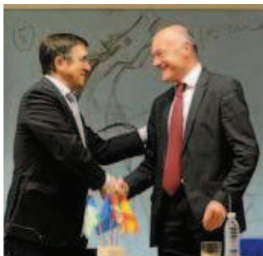
Patxi Lopez, chef du gouvernement basque et Alain Rousset, président de la Région Aquitaine, le 12 décembre 2011.

L'Eurorégion Aquitaine-Euskadi a été officiellement lancée le 12 décembre à Vitoria en Espagne avec la signature de la convention de coopération "Aquitaine-Euskadi" et des statuts portant création d'un Groupement Européen de Coopération Territoriale (GECT).